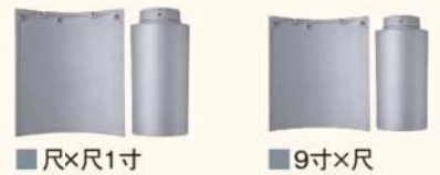
■ 尺×尺1寸 ■ 9寸×尺

尺×尺1寸 = 目安79枚/坪(働き長さ135mmの場合) 9寸×尺 = 目安99枚/坪(働き長さ120mmの場合) 8寸×9寸 = 目安126枚/坪(働き長さ105mmの場合)