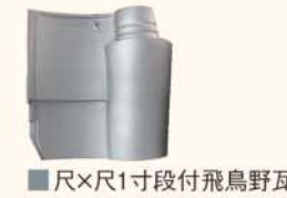
■ 尺×尺1寸段付飛鳥野瓦