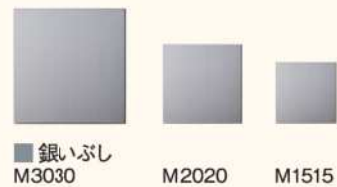
■ 銀いぶし M3030 ■ M2020 ■ M1515

実寸法(長さ×幅) M3030 = 37枚/坪 = 300×300mm M2020 = 83枚/坪 = 200×200mm M1515 = 147枚/坪 = 150×150mm