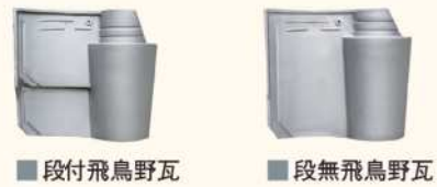
■ 段付飛鳥野瓦 ■ 段無飛鳥野瓦

働き寸法(長さ×幅) 9寸判=52枚/坪 = 237×273mm 尺判 = 40枚/坪 = 274×303mm